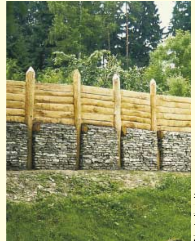
Rekonstruktion im Museum

im Naturpark Eggegebirge und südlicher Teutoburger Wald