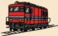
Schlucht an der alten Eisenbahn