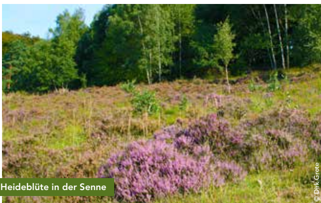
Heideblüte in der Senne

Anmeldung: bis 17.9., wandern@kalletal.de