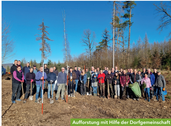
Aufforstung mit Hilfe der Dorfgemeinschaft

Ursprünglich wurde Germete als kleines Dorf im Diemeltal gegründet. Im Laufe seines über 1000-jährigen Bestehens veränderte sich nicht nur das Dorf, sondern auch die es umgebende Landschaft. Besonders deutlich wird dies in Wald und Flur. Aufgrund von erhöhtem Holzbedarf in diversen Kriegen, nach Brandkatastrophen und aktuell in Folge des Klimawandels zeigt „der Wald“ sich in einem stetig neuem Gesicht. Auch in der Landwirtschaft vollzog sich über die Jahrhunderte ein Wandel: Durch zunehmende Technisierung entstanden immer größere Äcker mit einer geringen Auswahl an Anbaufrüchten. Letztlich führte die Erschließung der Mineralwasserquellen um 1900 zu einer Art Industrialisierung des Dorfes, was sich auch bis heute im Dorfbild niederschlägt.