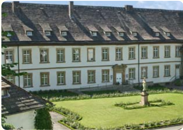
Heute ein barrierefrei gestaltetes Gästehaus: die historische Anlage des ehemaligen Klosters und jetzigen Schlosses Gehrden.