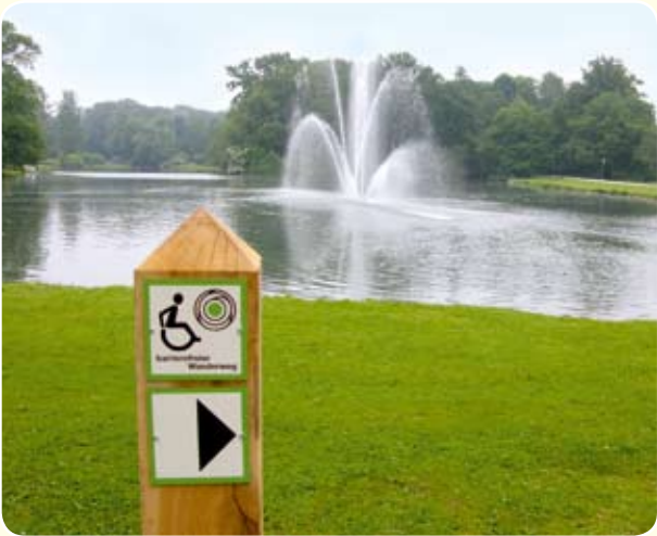
Einfach mal die Seele baumeln lassen: Auf den barrierefreien Wegen im Staatsbad Salzuflen lässt sich Natur hautnah erleben.