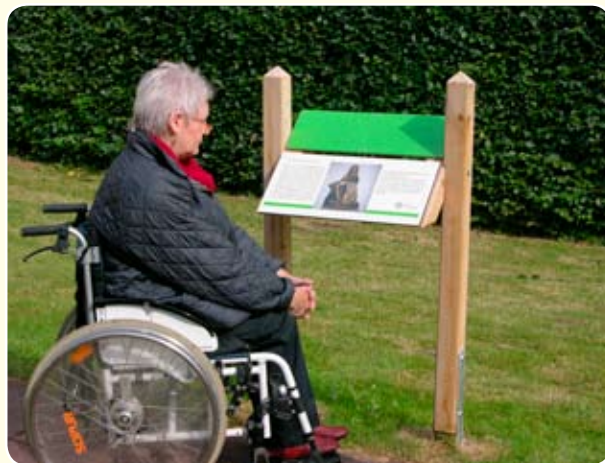
Naturpark für alle: Überall dort, wo es Interessantes zu vermitteln gibt, sind die barrierefreien Wege von behindertengerechten Schautafeln gesäumt.