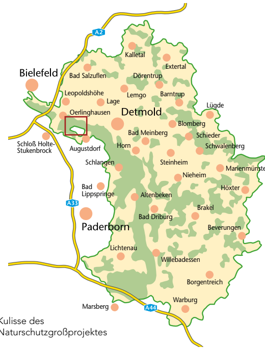
Kulisse des Naturschutzgroßprojektes