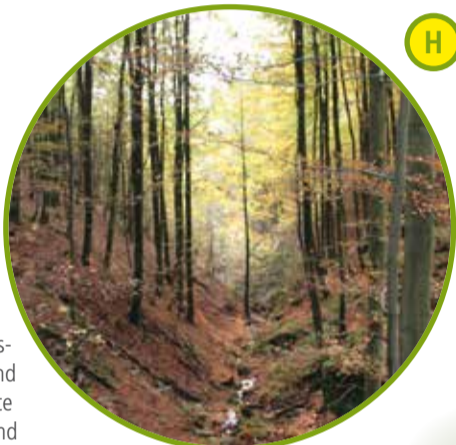
Naturpark Teutoburger Wald Eggegebirge

Natur in Hülle und Fülle, eindrucksvolle Landmarken, eine malerische Mittelgebirgslandschaft mit einer hohen Dichte an naturkundlichen und kulturgeschichtlichen Highlights – das ist der Naturpark Teutoburger Wald/Eggegebirge. Die vielfältigen Landschaftsräume und Waldgebiete im Naturpark sind Rückzugsgebiete für seltene und bedrohte Tierarten. Ausgewählte Erlebnisrouten und zertifizierte Qualitätswege führen durch eine malerische Landschaft. Hier können Sie Natur mit allen Sinnen erleben. www.naturpark-teutoburgerwald.de