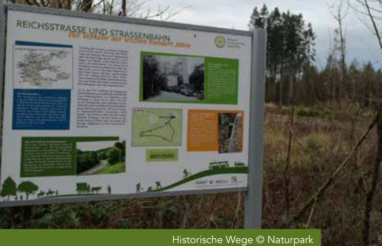
Historische Wege