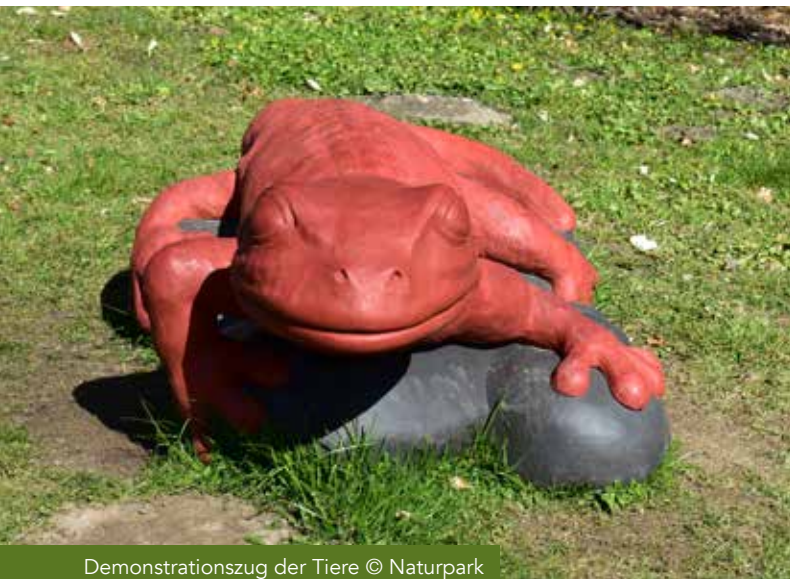
Demonstrationszug der Tiere

Naturerlebnis „Wald“, Wanderparkplätze direkt vor dem Waldrand /Ortsrand, Ende der „Lange Straße“, 34431 Marsberg-Meerhof