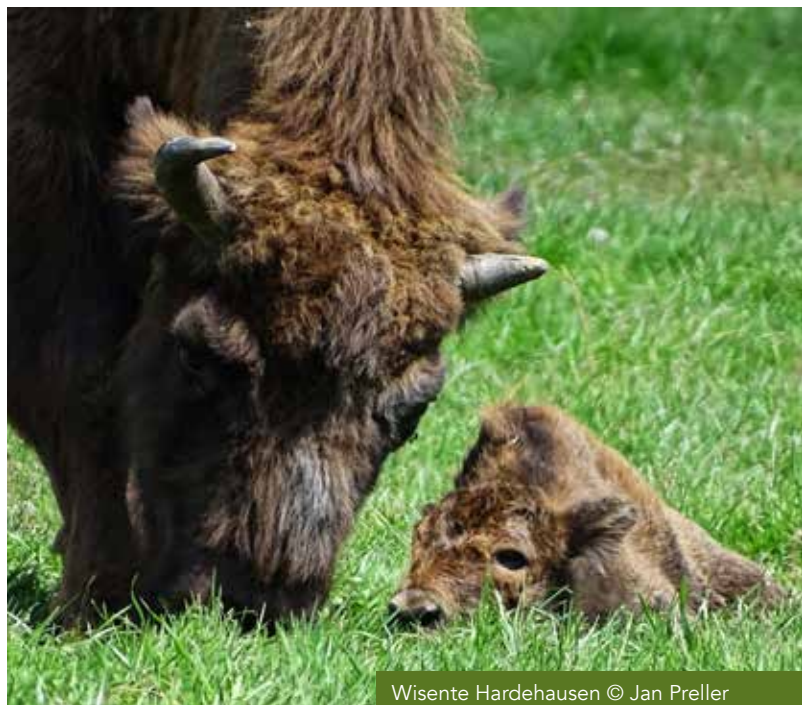
Wisente Hardehausen

Start: 14:30 Uhr Bahnhof Ottbergen, Bahnhofstraße 19, 37671 Höxter-Ottbergen Dauer: 2 Stunden Kosten: 4 €, Kinder frei Anmeldung: Naturparkführer Dietmar Barkhausen, Mobil: 0176-660 65 169; E-Mail: d.barkhausen@naturparkfuehrer.org