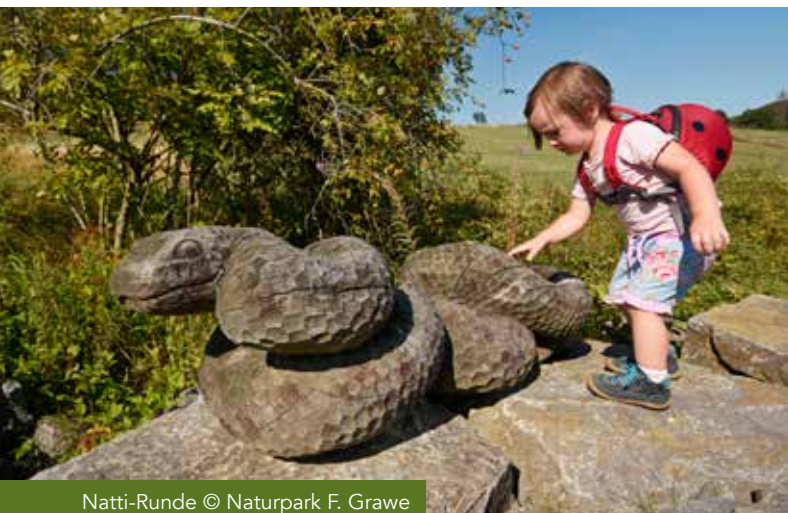
Natti-Runde