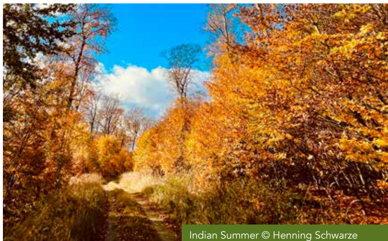
Indian Summer

Start: 9:30 Uhr am Dorfbrunnen vor dem Rathaus, Im Dorfe, 33189 Schlangen Dauer: 3 - 3,5 Stunden Kosten: keine Anmeldung: Naturparkführer Henning Schwarze, touren@senne-teuto-egge.de; Tel.: 015678 457938