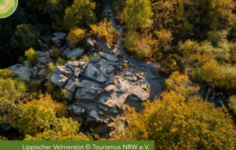
Lippischer Velmerstot