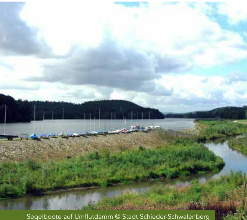
Segelboote auf Umflutdamm