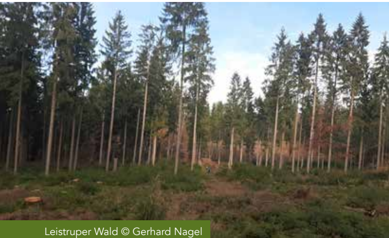
Leistruper Wald

Start: 4:30 Uhr am Wanderparkplatz Ende Leistruper-Wald-Straße, 32760 Detmold-Diestelbruch Dauer: 2,5 Stunden Kosten: 4 Euro, Kinder Frei Anmeldung: Naturparkführer Gerhard Nagel, Blumenstr.3, 32825 Blomberg; Tel.: 05235-8610, gerhard.nagel@t-online.de