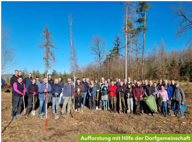
Aufforstung mit Hilfe der Dorfgemeinschaft

Ursprünglich wurde Germete als kleines Dorf im Diemeltal gegründet. Im Laufe seines über 1000-jährigen Bestehens veränderte sich nicht nur das Dorf, sondern auch die es umgebende Landschaft. Besonders deutlich wird dies in Wald und Flur. Aufgrund von erhöhtem Holzbedarf in diversen Kriegen, nach Brandkatastrophen und aktuell in Folge des Klimawandels zeigt „der Wald“ sich in einem stetig neuem Gesicht. Auch in der Landwirtschaft vollzog sich über die Jahrhunderte ein Wandel: Durch zunehmende Technisierung entstanden immer größere Äcker mit einer geringen Auswahl an Anbaufrüchten. Letztlich führte die Erschließung der Mineralwasserquellen um 1900 zu einer Art Industrialisierung des Dorfes, was sich auch bis heute im Dorfbild niederschlägt.